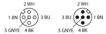
diagrama de conexiones